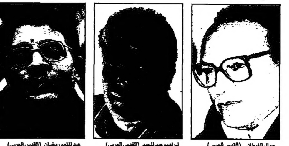
جمال الفيثاني (القدس العربي) - إبراهيم عبد الجليل (القدس العربي) - عبد المنعم رمضان (القدس العربي)